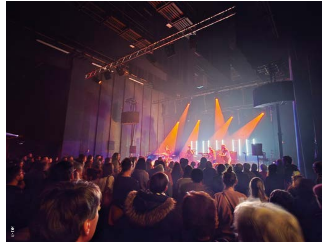
Vous étiez plus de 500 à participer à cette soirée rock co-organisée avec Le Bruit qui Tourne.

En couverture: The Brutalist De Brady Corbet